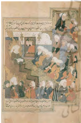
شکل ۸. نفحات الانس ۲