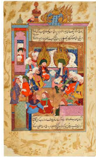
شکل ۵. ثواقب المناقب ۱