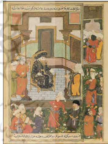
شکل ۷. جامع السیر ۱

به عقیدهٔ باربارا فلمینگ «مکتب کتاب آرای بی بغداد عثمانی انعکاس دهنده دستاوردهای هنر ایرانی