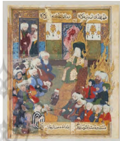
شکل ۳. مقتل الرسول ۱

ثواقب المناقب شرحی بر احوال مشایخ سلسله مولویه است. در این نسخه، هنرمند تصویر اهل بیت (ع) را در کنار پیامبر (ص) با هاله نورانی ترسیم کرده است که قداست و نزدیکی ایشان به پیامبر (ص) را نشان می‌دهد. (شکل ۵ و ۶) نسخه خطی نفحات الانس مهم‌ترین کتاب مکتب بغداد در بیان حقایق عرفانی و ذکر احوال عارفان است. در نگاره‌های این نسخه نیز ویژگی‌های هنر ایرانی مانند موارد پیشین نمایان است. افزون بر آن هنرمند با پوشاندن چهره پیامبر (ص) و اهل بیت (ع) و ترسیم هاله نورانی بر اطراف بدن ایشان، توجه ویژه خود به ائمه (ع) را تصویر کرده است. (شکل ۷ و ۸)