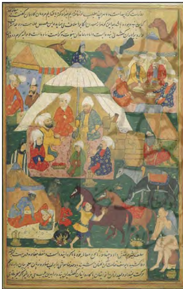
شکل ۲. روضه الصفا ۲

در نسخهٔ روضه الصفا تأثیر هنر ایرانی با قدرت بیشتری به نمایش درآمده است. (شکل ۲) افزون بر موارد پیشین، تلاش هنرمند برای نمایش فضای چندپلانی و روایت همزمان چند واقعه، ویژگی ایرانی اثر را نشان می‌دهد. این همان اصلی است که در مکتب‌های درخشان کتاب‌آرایی ایران به نمایش فضای چندساحتی شهرت دارد. با این حال تأثیر هنر عثمانی همانند نگارۀ پیشین وجود دارد.