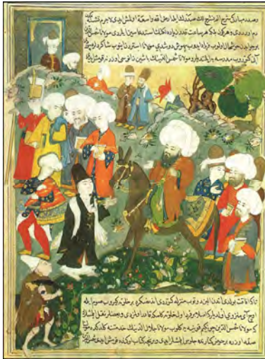
شکل ۶. جامع السیر ۲