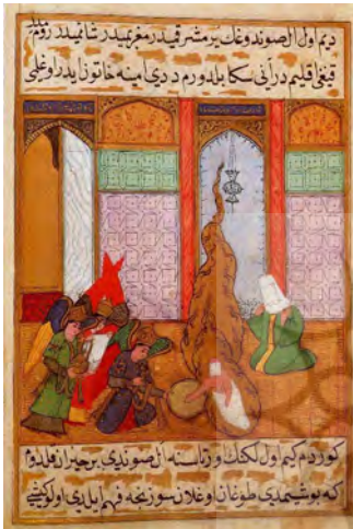
شکل ۴. سیر النبی ۲

می‌پردازد. ترکیب‌بندی نگاره‌های این نسخه و خروج اجزای نگاره از کادر تصویر، تأثیرپذیری از ترکیب‌بندی نگاره‌های ایرانی را نشان می‌دهد. (شکل ۳) در نسخه سیر النبی با وجود اینکه تصاویر تقلیدی از سبک ایرانی است و همان ویژگی‌های نسخ پیشین را نمایش می‌دهد، سبک و شیوه جدید ترکی نیز در آن نمایان است. از تفاوت‌های سبک ایرانی و ترکی، استفاده از رنگهای قومی، جزئیات کم و به کارگیری قلم و قلم موهای پهن است. (شکل ۴)