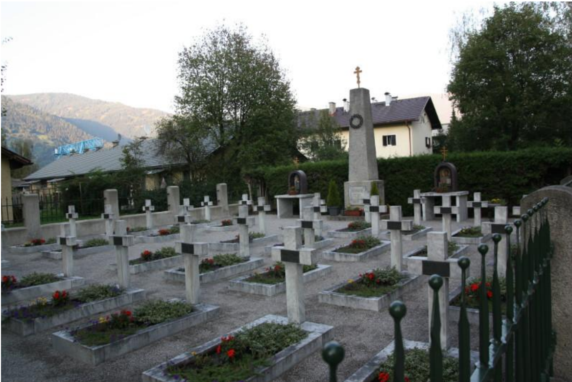
Казачье кладбище в г. Лиенц, Австрия