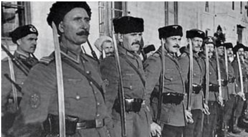
Личный конвой генерала Г. фон Паннвица