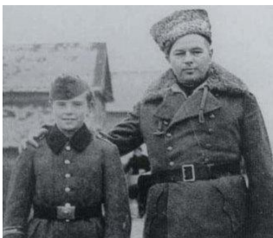
Казачата в Вермахте