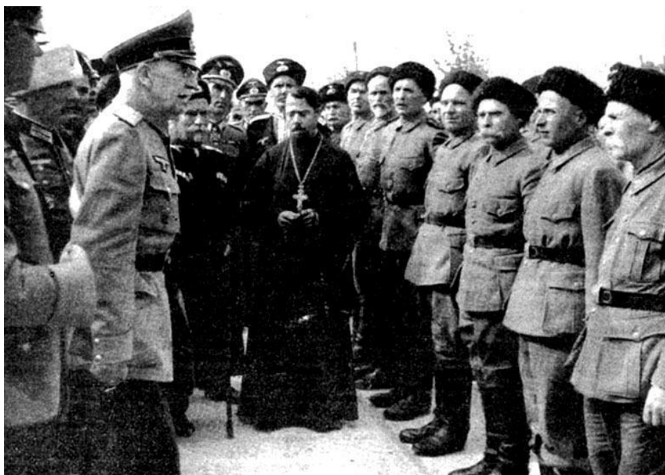
Генерал П.Н.Краснов беседует с казаками. Югославия, 1943 г.