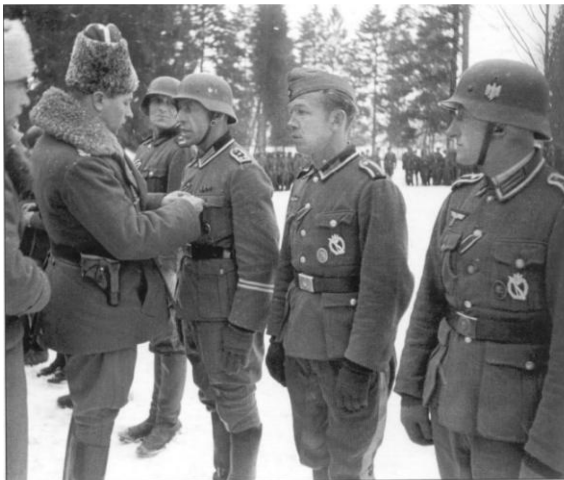
Генерал Г. фон Паннвиц награждает казаков.