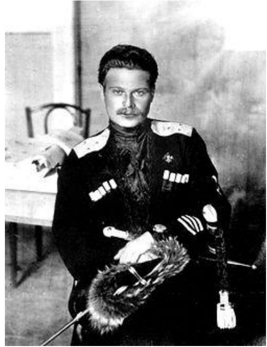
В годы Первой мировой и Гражданской войн. П.Н.Краснов и А.Г.Шкуро