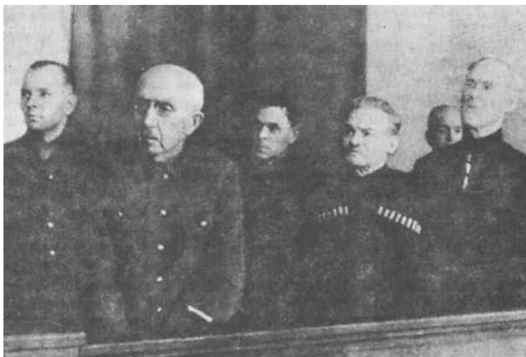
Приговор... Слева направо: Г.фон Паннвиц, П.Н.Краснов, С.Н.Краснов, А.Г.Шкуро, Т.И.Доманов, С.Гирей-Клыч