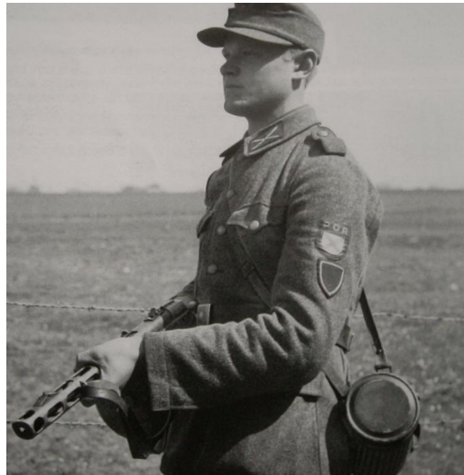
Бойцы РОА – «власовцы»