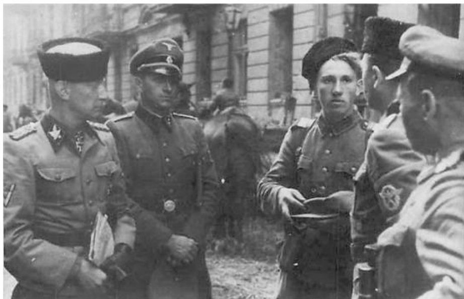
Казаки и чины Русской Освободительной Армии (РОА) во время подавления Варшавского восстания. Август 1944 г.