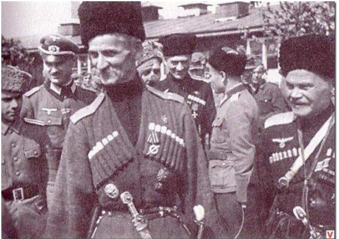
Казачьи генералы В.Г. Науменко и А.Г. Шкуро. Югославия, 1943 г.