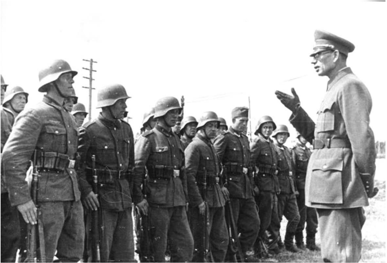
Генерал А.А. Власов и бойцы РОА