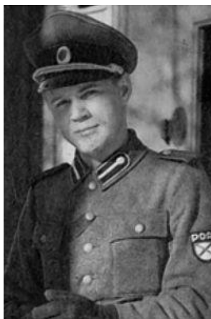
Казачи и офицер РОА