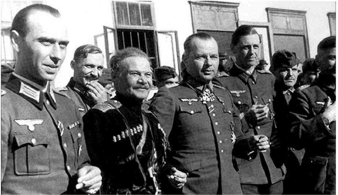
А.Г. Шкуро и Г. фон Паннвиц с германскими и казачьими офицерами. Югославия, 1943 г.