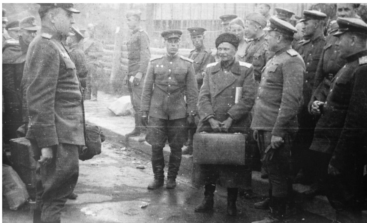
Выдача генерала А.Г.Шкуро представителям СССР, 1945 г.