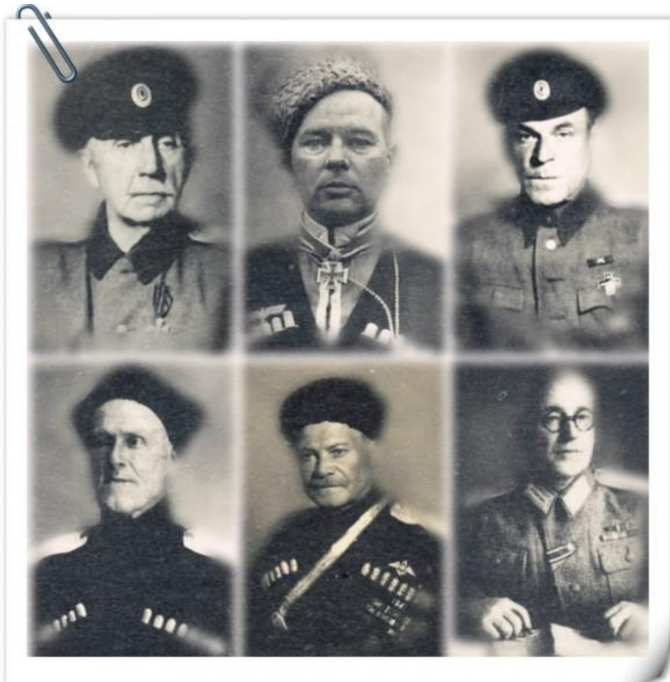
Главные обвиняемые на процессе казачьих генералов. Верхний ряд: П.Н.Краснов, Г.фон Паннвиц, С.Н.Краснов Нижний ряд: С.Гирей-Клыч, А.Г.Шкуро, Т.И.Доманов