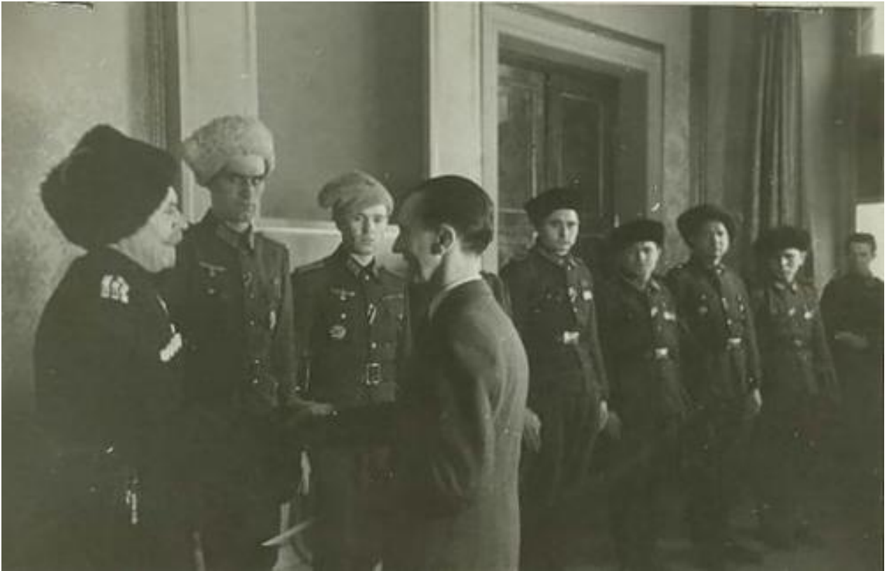
Атаман Кулаков и терские казаки на аудиенции у рейхсминистра Йозефа Геббельса