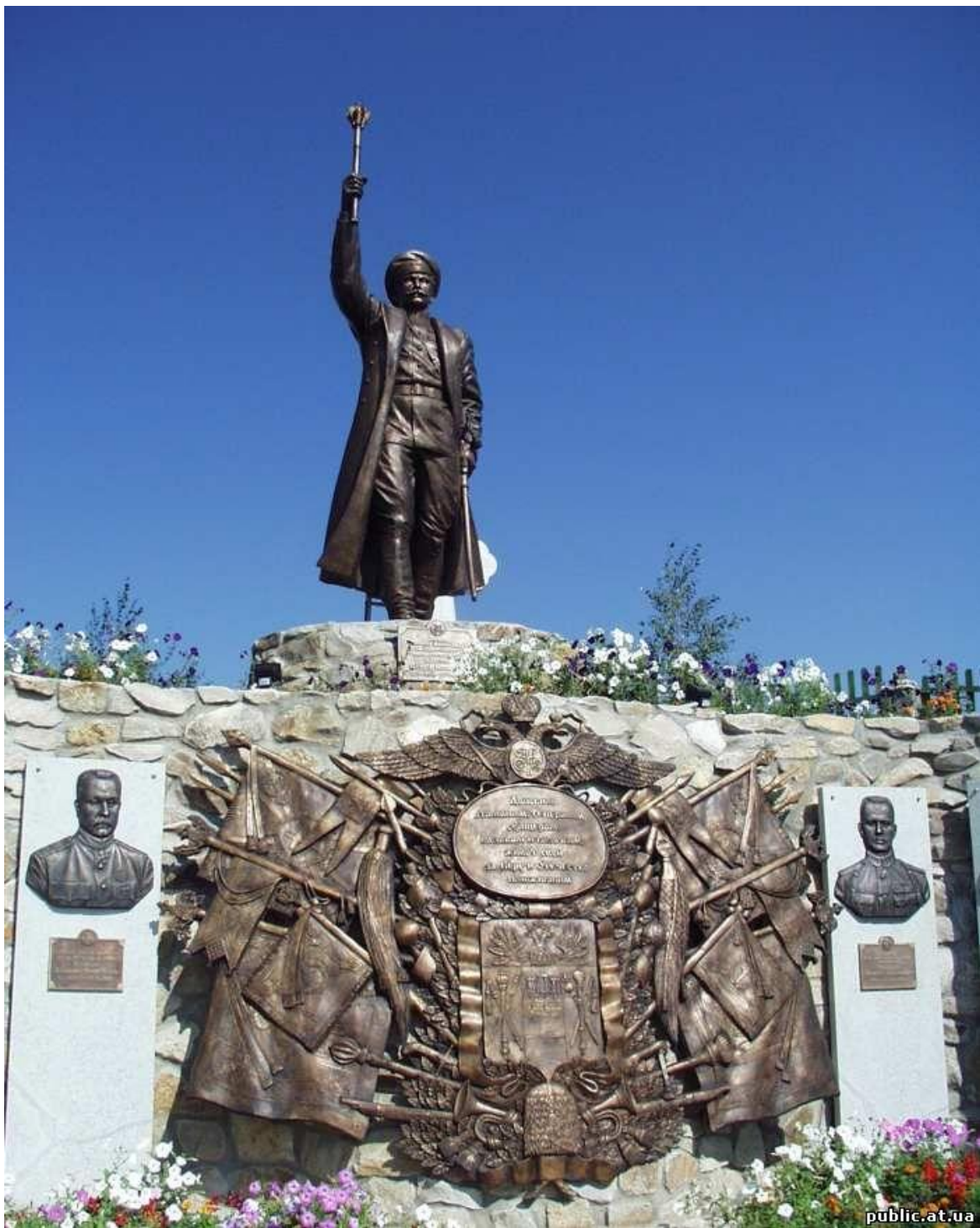
Памятник атаману П.Н.Краснову в станице Еланской Шолоховского района Ростовской области. Открыт в 2007 г.