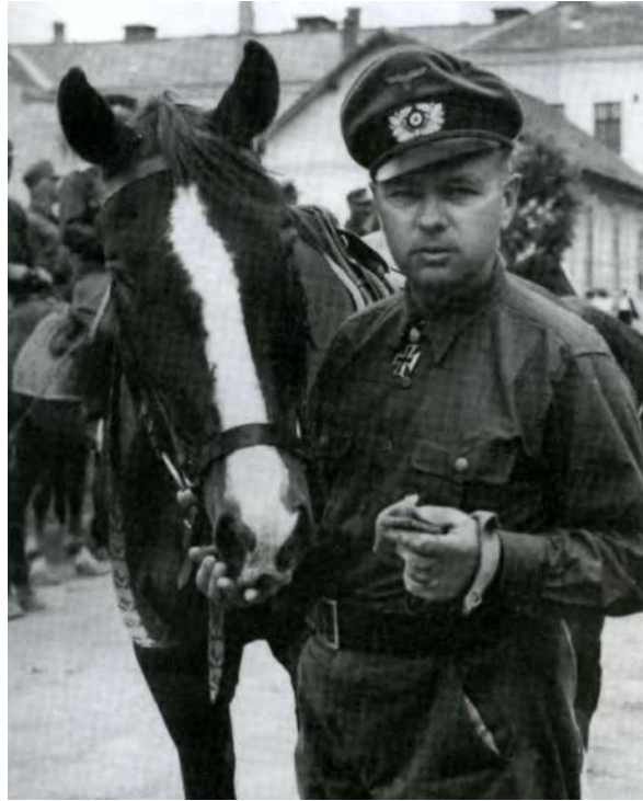
П.Н.Краснов и Г. фон Паннвиц