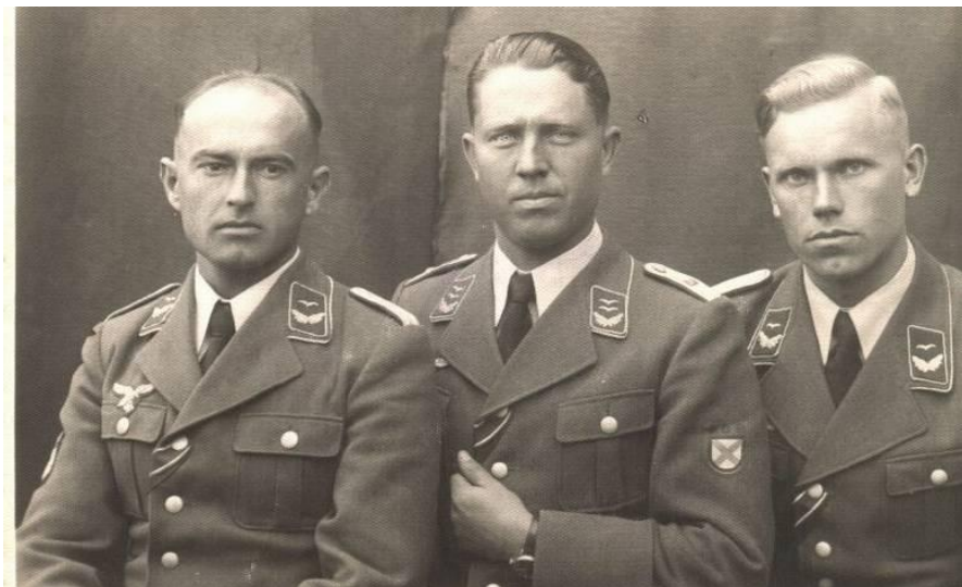
Офицеры ВВС РОА