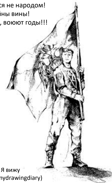
Иллюстрация: Я вижу ( https://t.me/mydrawingdiary )