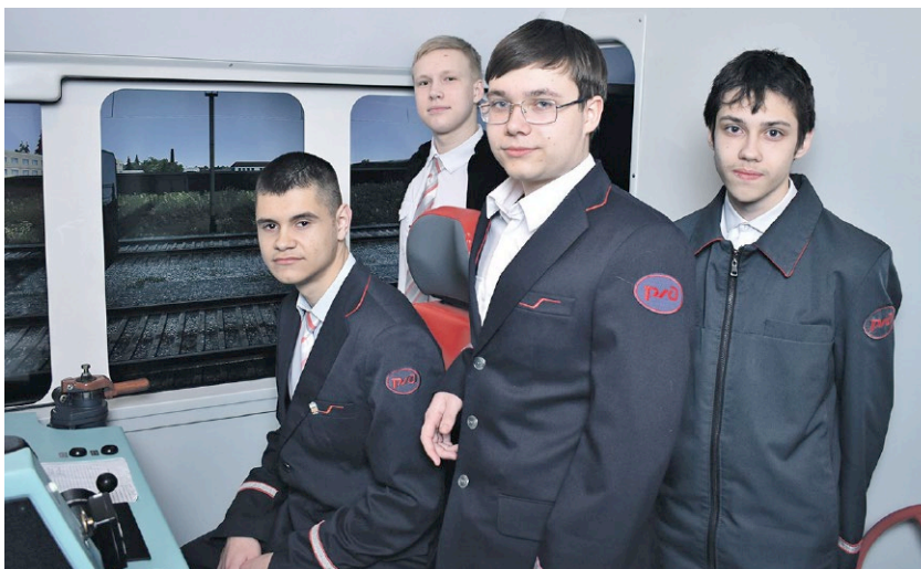
АРХИВ ЕКАТЕРИНБУРГ-СОТИРОВОЧНОГО ПОДРАЗДЕЛЕНИЯ СВУЦПК

Во время экскурсии по отраслевому образовательному учреждению гости, в основном старшекласники, заглянули в учебные классы. Скоро им предстоит определиться с будущей профессией. Преподаватели описали преимущества выбора в пользу стальной магистрали.