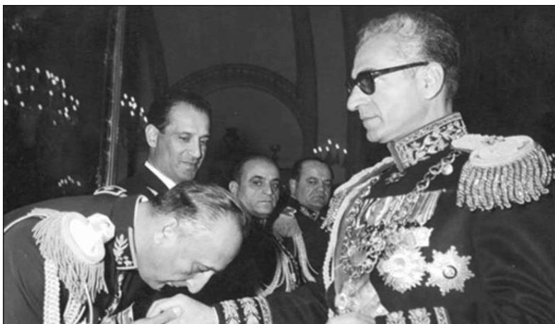
Image caption

ارتشبد نعمت‌الله نصیری، از رؤسای اسبق ساواک، در حال دست‌بوسی شاه