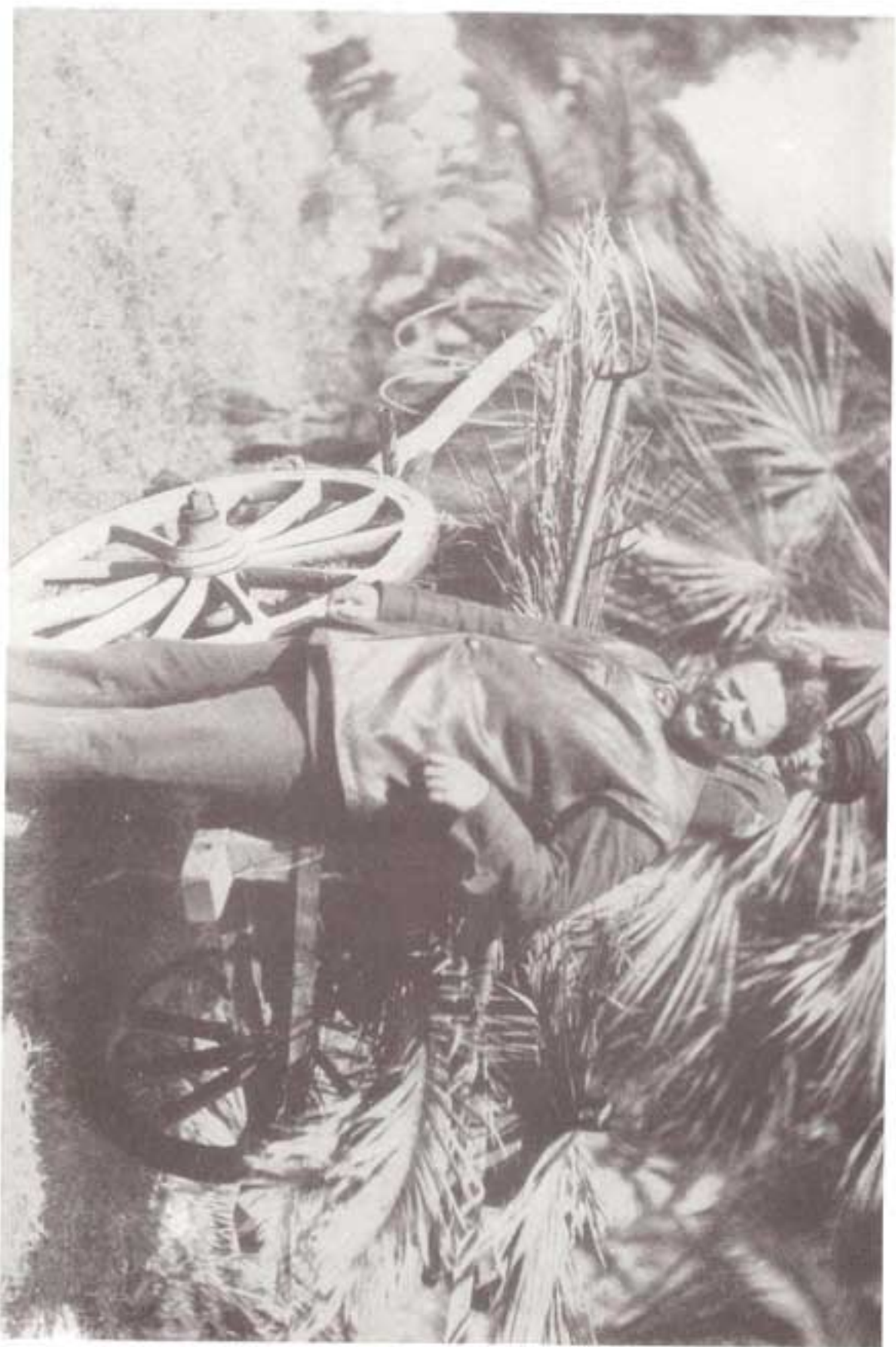
تروئسکی، ۱۹۲۴ میلادی، در ایام استراحت در قفقاز