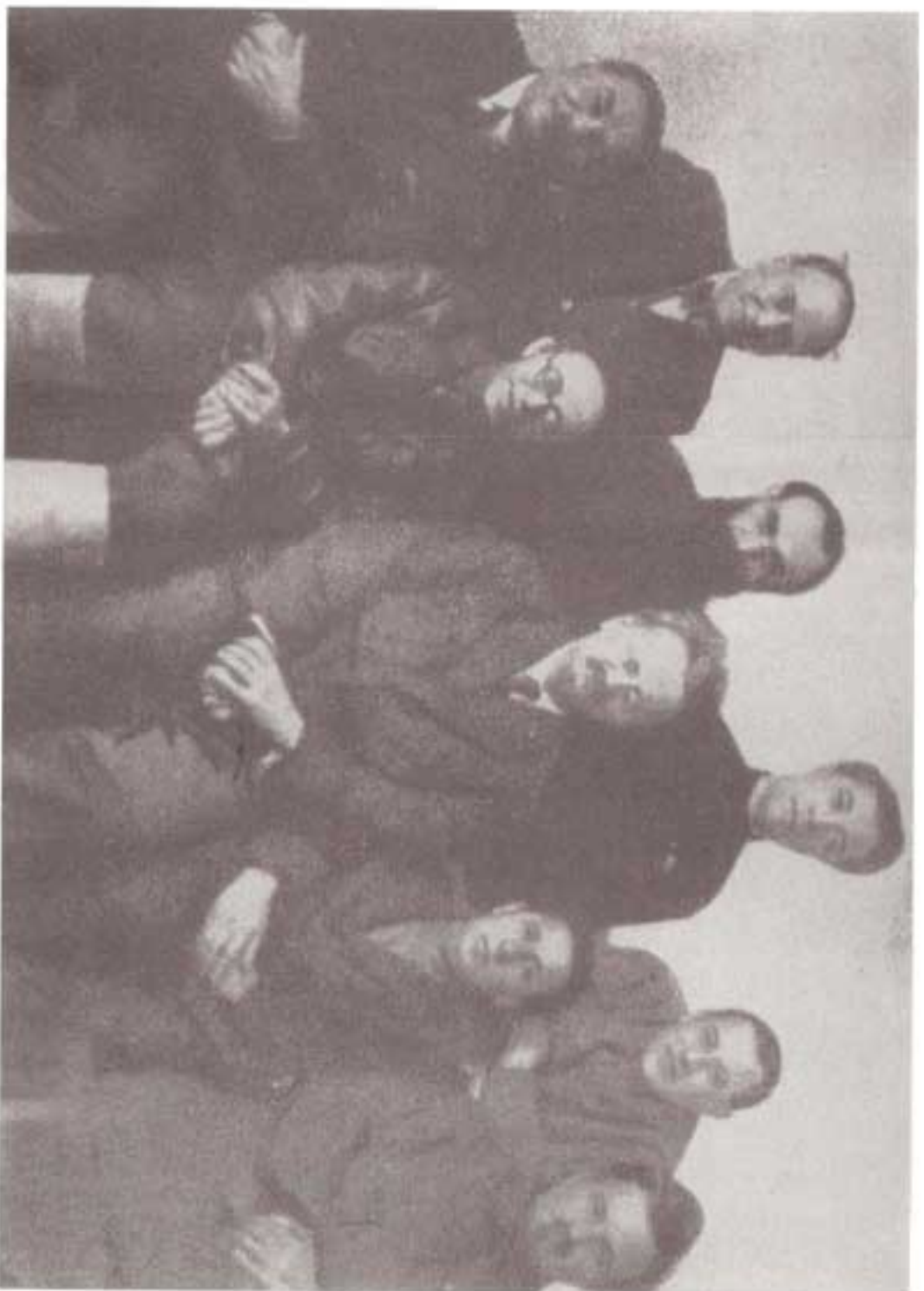
رهبران گروه مخالفان که در ۱۹۳۷ میلادی از حزب اخراج شدند