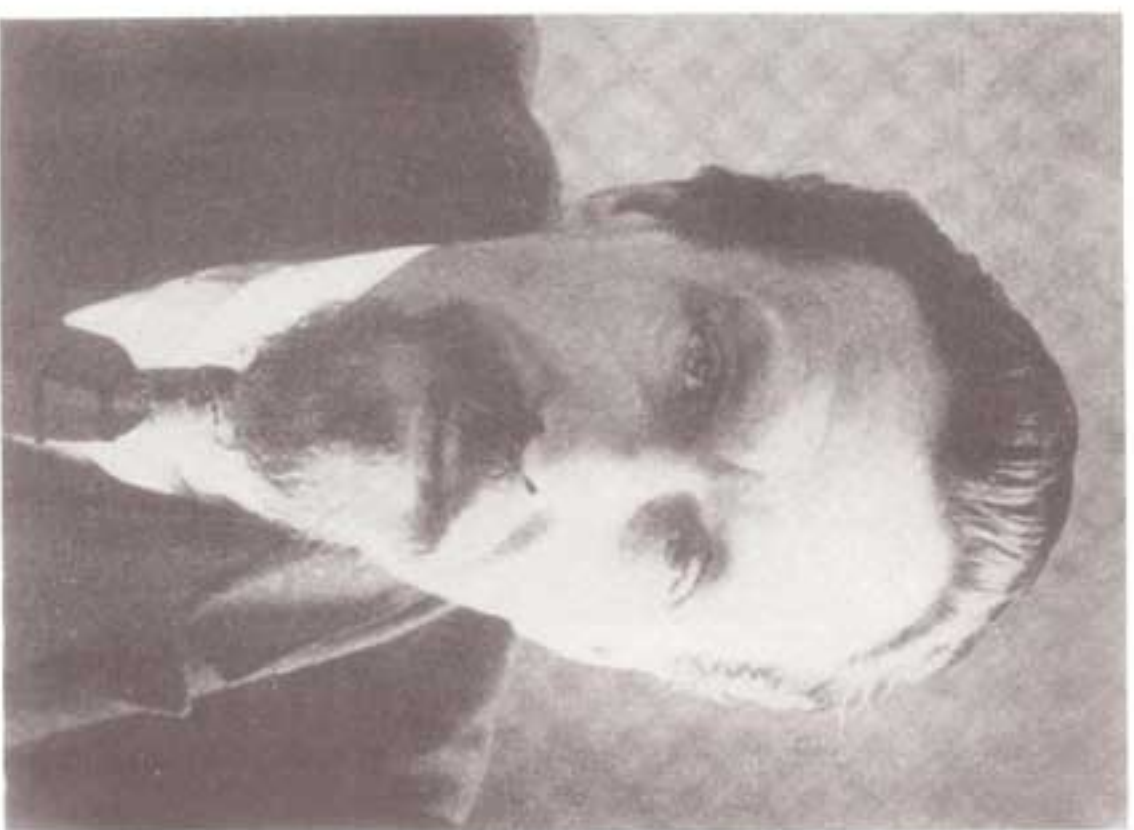
ریکوف، رئیس شورای عالی اقتصاد ملی