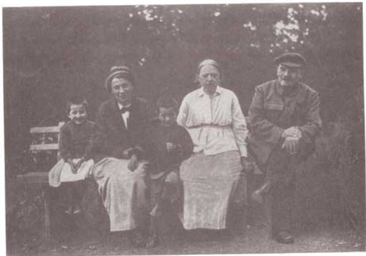
لنین و خانواده اش: کروپسکایا، همسرش در کنار لنین، و خواهر لنین الیزارووا