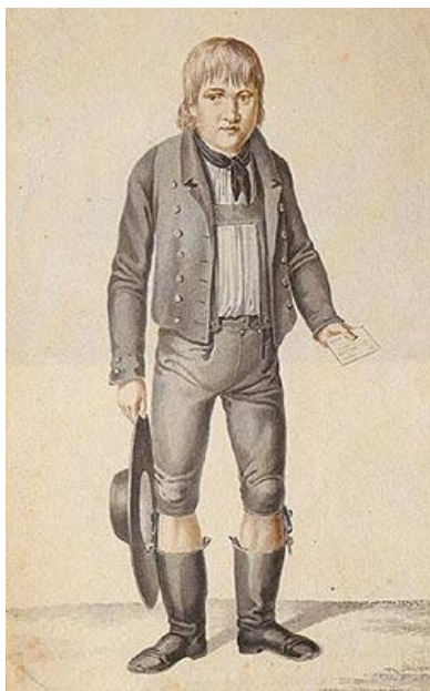
Рис. 3. Каспар Хаузер

Он плакал, кричал, смеялся и проявлял крайние эмоции без видимых причин, часто пугался действий, не несущих угрозы, или, что более странно, без причины вообще. На теле у него было множество порезов, и шрамов и он нередко жаловался на головную боль. Этот мальчик во всем явился загадкой, недоступной пониманию простых опекунов, которым была поручена забота о нем.