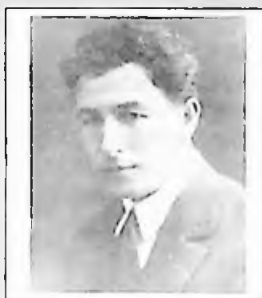
Абдулла Лятиф- заденинъ догъгъанына 115 йыл олды

1930-ынджы йылларнынъ сонъларында узилип, агешлерге быракъылгъан чечек киби мунев-верлеримиз арасында Абдулла Лятиф-заде де бар. Илыкъ шиирлеринде («Хаял-омюр», 1910 «Къайгъым», 1918 с.) къалемининъ назиклигини къосьтере бильген лирик шаир, сонъра чешит объектив себеplerден озюнинъ дюньябакъыш концепциясыны денъиштирип, «замангъа уймагъа» меджбур олды, дигер бир сыра шаирлеримиз киби шиарджылыкъ ве публицистикагъа къапылды.