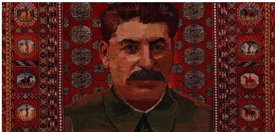
Известный факт — товарищ Сталин не любил ковры...

Фоновая функция такая же сильная, как и базовая. Четырехмерная, но не ценностная. Человек всегда, непрерывно отслеживает информацию по фоновой функции, но в речи ее отследить не так легко, потому что функция витальная и обсуждается редко, однако работает исправно.