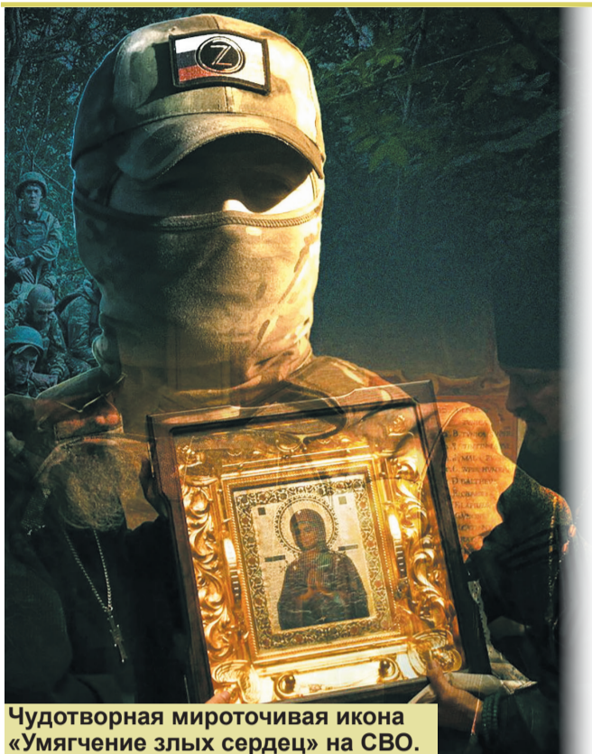
Чудотворная мироточивая икона «Умягчение злых сердец» на СВО.