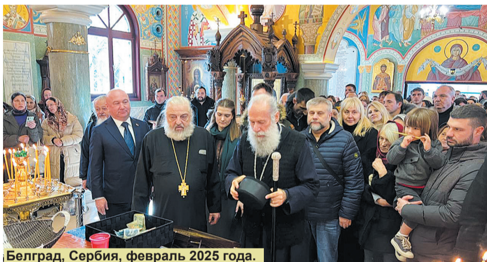
Белград, Сербия, февраль 2025 года.