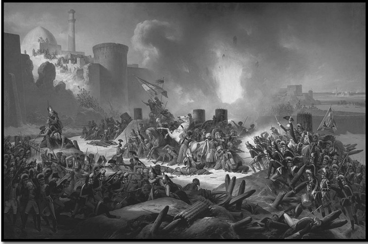
Resim:1-Özi Kalesi Kuşatmasına Ait Bir Tasvir

(Erişim: http://en.wikipedia.org/wiki/RussoTurkish_War_(1787%E2%80%931792) Erişim Tarihi: 16.11.2011)